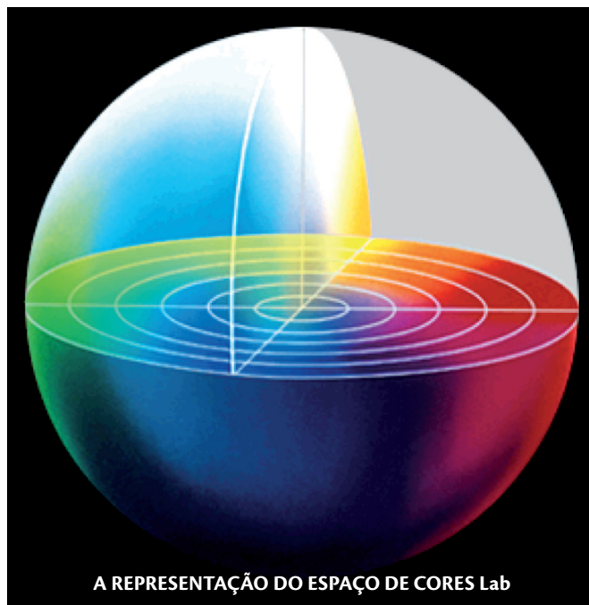
A REPRESENTAÇÃO DO ESPAÇO DE CORES Lab

Essa norma já prevê que existam discrepância entre diferentes instrumentos e lança mão de materiais de referência certificados (CRM) para a calibração inter-instrumentos. Quanto à fonte de luz do espectrofotômetro, a norma ISO 3664 diz que “para minimizar as variações entre instrumentos devido ao uso de