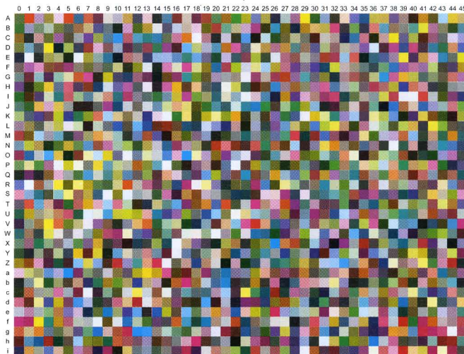
Versão aleatória da norma ISO 12642-2

É importante salientar que os sistemas de gerenciamento de cores que utilizam alvos IT8.7/4 (que estão baseados na antiga norma 12642) passam a ser considerados com base na norma atual 12642-1 e ainda compatíveis. Futuramente, esses sistemas deverão sofrer atualizações para a versão 12642-2, melhorando a sua funcionalidade ou ampliando a sua aplicação.